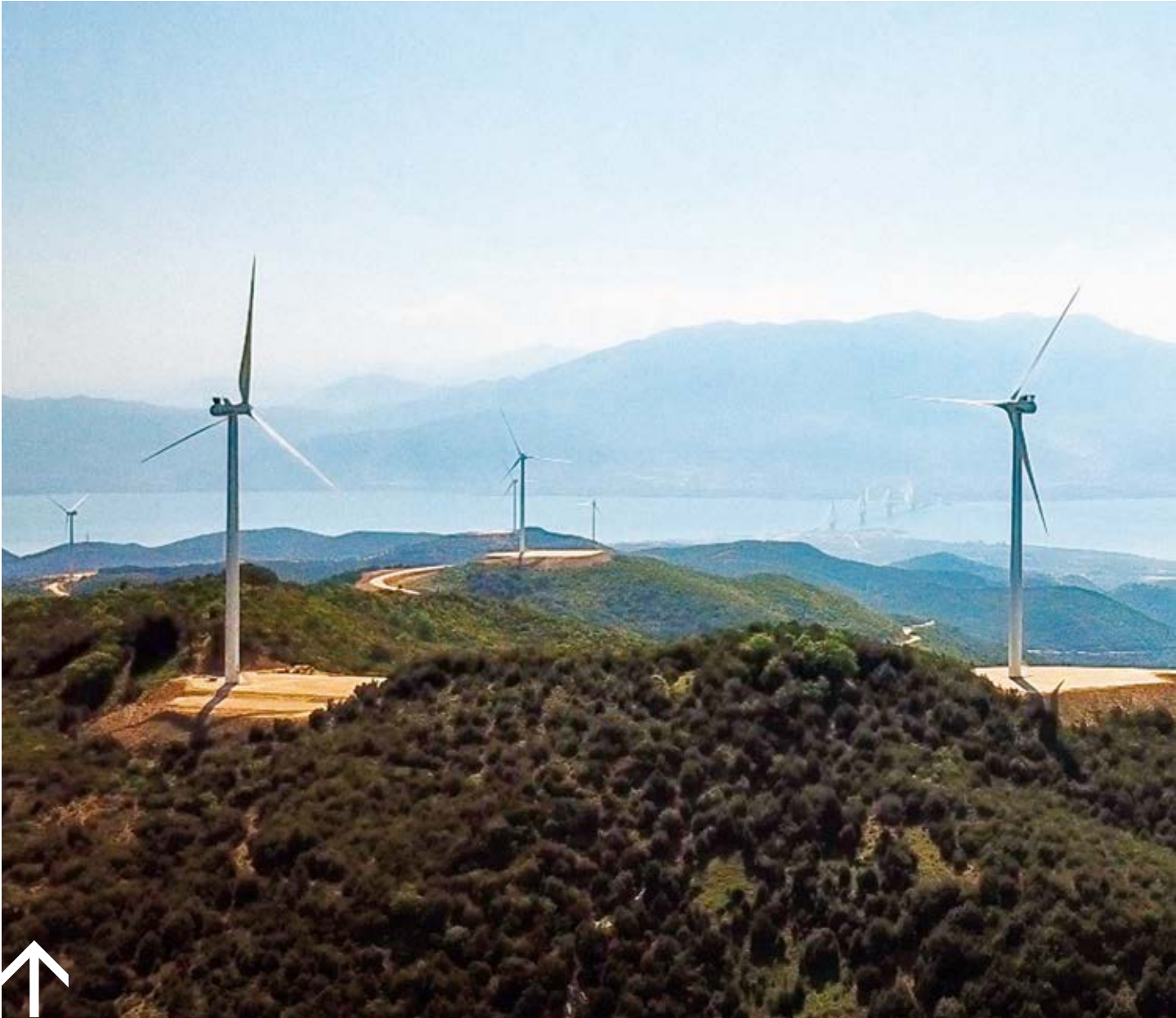
ΚΟΥΡΟΜΑΝΤΡΙ ΡΙΓΑΝΟΛΑΚΚΑ / ΑΙΟΛΙΚΟ ΠΑΡΚΟ VOLTERRA

Στην από κοινού ανάπτυξη και εκμετάλλευση αιολικών πάρκων συνολικής ισχύος 69,7 MW συμφώνησαν και προχωρούν η ΔΕΗ (μέσω της ΔΕΗ-ΑΝ) και η VOLTERRA, θυγατρική του μεγάλου κατασκευαστικού ομίλου AVAX. Συγκεκριμένα, η ΔΕΗ εξαγοράζει το 45% των μετοχών δυο εταιρειών (SPV) της VOLTERRA που έχουν στην κατοχή τους αντίστοιχα η μία δυο αιολικά πάρκα στην Αιτωλοακαρνανία ισχύος 16 MW που ήδη