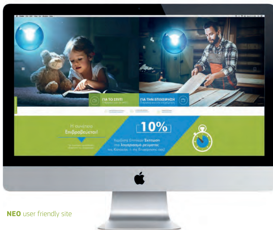
NEO user friendly site